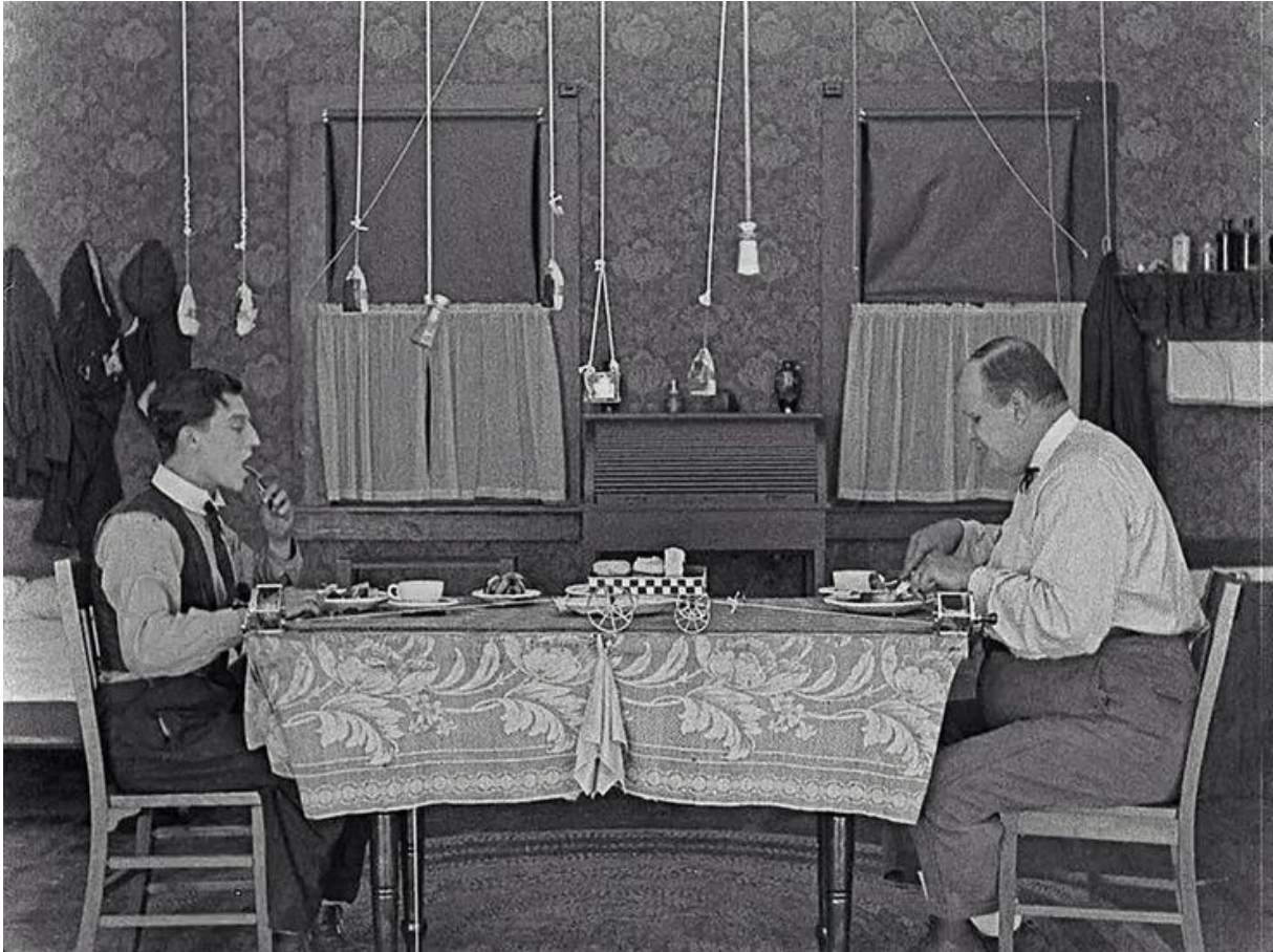
Bilde: Kreative kjøkkenløsninger i Buster Keatons slapstick-klassiker The Scarecrow , fra 1920.