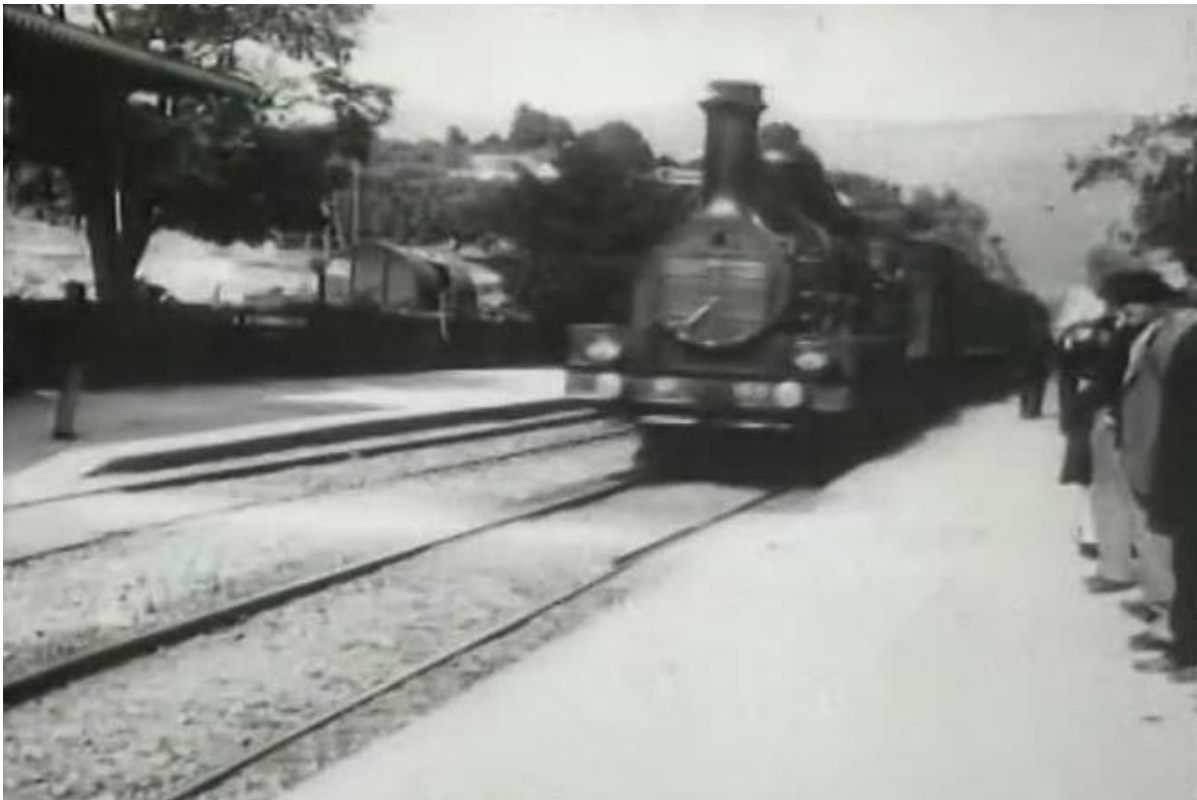
Bilde: Et tog ankommer stasjonen , laget av brødrene Lumiere i 1895.

En utfordring med stumfilmene var at publikum ikke visste hva folk i filmene sa. Dette løste man ved å ha stemmeskuespillere til å fremføre replikker i kinosalen. Etter hvert fikk også filmene mellomtekster. Tekstene besto gjerne av replikker eller beskrivelse av handling. Noen ganger inneholdt de også sangtekster, så publikum kunne syng med på filmenes musikalske partier.