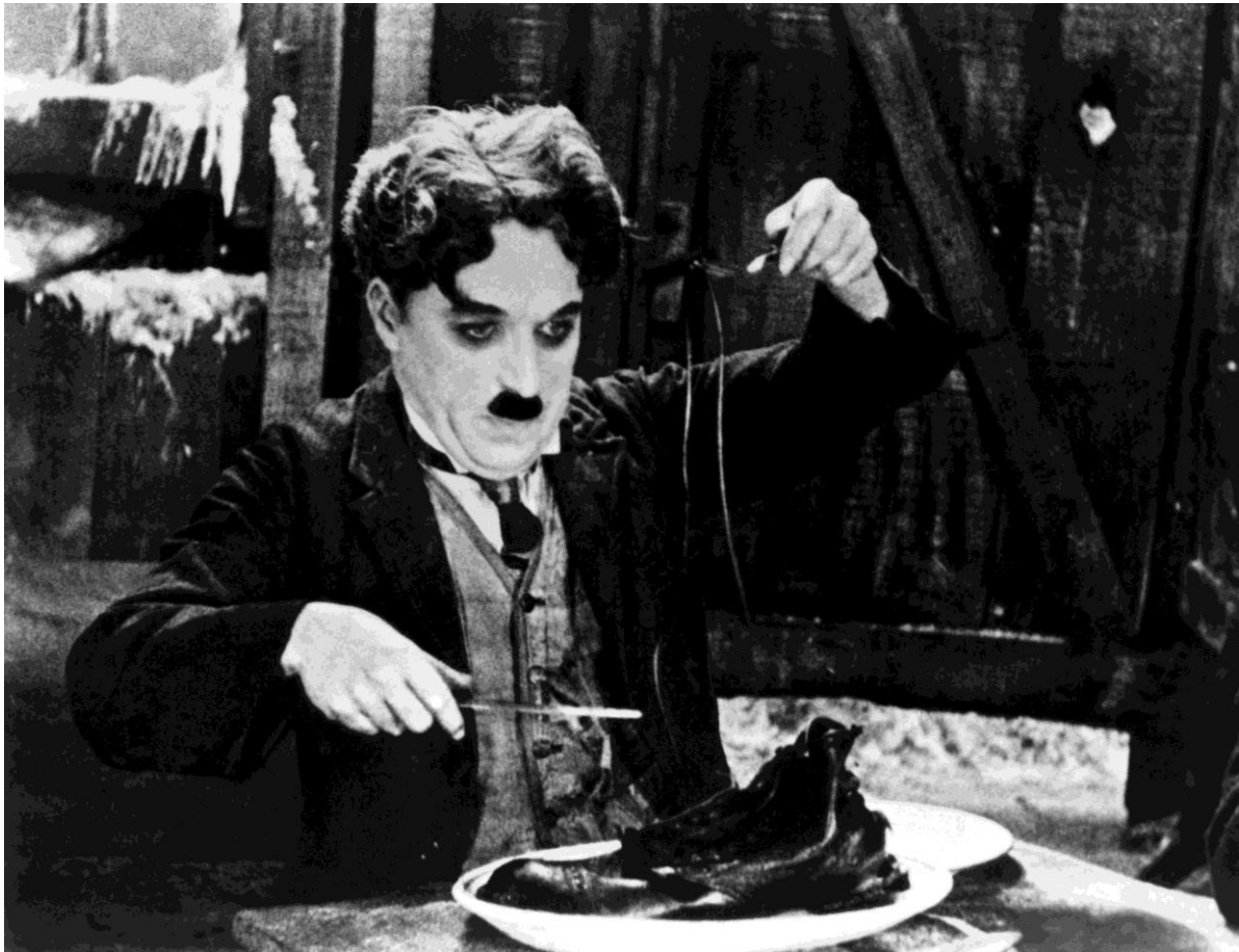
Bilde: Hvordan høres det egentlig ut å spise en sko? Charlie Chaplin i filmen Gullfeber , fra 1925.

Når lyd spilles inn direkte til de ferdige filmbildene, kaller vi det for foley-lyd. Lydopptakene gjøres av foley-artister, som er en slags «lydskuespillere». Når lydskuespillerne tar opp lyd, må de tilpasse lydene de lager perfekt til det som skjer i filmen. Se for deg en filmscene der en person går gjennom et rom: Kommer skrittene fra en mann eller en dame? Er personen stor eller liten? Er gulvet i rommet hardt eller mykt? Foley-artistens oppgave er å gjøre lyden så ekte og naturlig som mulig, så publikum ikke tenker over at lyden er lagt på bildene i ettertid. Foley-lyd ble utviklet av amerikaneren Jack Foley. Han oppdaget at den mest effektive måten å forbedre lyd på i film var ved å lage lydene selv. Kjente eksempler på foley-lyd er knirkende dører, klær som rasler og fottrinn.