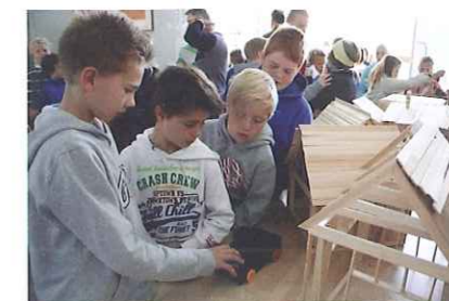
Fra Kulturfestivalen ved Kastellet skole.

Bildet nedenfor: Portrett. Ved Sørkedalen skole har lokale kunstnere deltatt i prosjektet. Her begynner arbeidet med at elevene selv henter leire fra Sørkedalselva, bearbeider den og lager ulike produkter som de til slutt selger. Prosjektet bygger opp under skolens bruk av lokalmiljø, styrker skolens fokus på uteskole og bruk av naturen i nærområdet. Prosessen har gitt elevene innblikk i at det finnes verdier og utnyttede ressurser i vårt lokalmiljø, og at disse ressursene må forvaltes på en klok måte. (Fra skolens rapport).